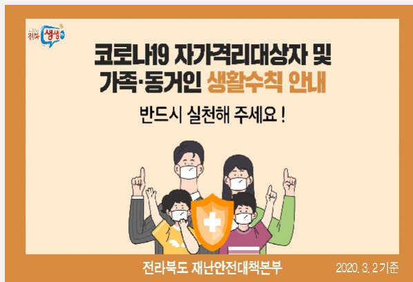
자가격리대상자 생활수칙 코로나19 자가격리 대상자 및 가족, 동거인 생활 수칙...

마스크 원자재 생산 기업 시찰 차질없는 공급 당부 ▶ 전라북도 코로나바이러스 감염증-19 일일상황을 확인해주세요! ◀ 글, 사진 = 전라북도청