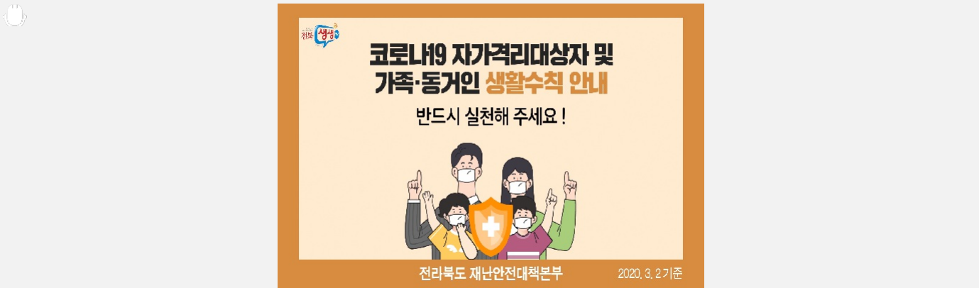
자가격리대상자 생활수칙 코로나19 자가격리 대상자 및 가족, 동거인 생활 수칙...

b 코로나 19 생활치료센터 알아보기 생활치료센터에서 빠르고 편안하게 치료 받으세요! ▶코로나바이러스 감염증-19 선별진료 의료기관 실시간 확인 ◀