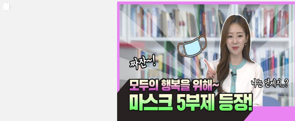
마스크 수급 안정화 대책 지난 5일 정부가 발표한 마스크 수급 안정화 대책 다...

b 전북도, 코로나 19 추경 포함 4,300억원 경제살리기에 올인 코로나19 대응 전라북도 소상공인 지원정책이 전북도가 코로나19로 인해 매출감소 등 경영난을 겪고 있는 소상공인들을 살리기 위해 파격적인 지원에 나섰습니다. 전북도는 전국 시도 중 최초로 긴급 추경예산을 반영했습니다. 지원 정책은 다음과 같습니다. 경영 유지 지원 소상공인 절반 이상 110만원 지원 고용 유지 지원 고용 위축과 고용 불안 해소 상권 활성화 지원 전국 최초 확진자 방문 소상공인 점포 임대료 지원 자금 완화 소상공인