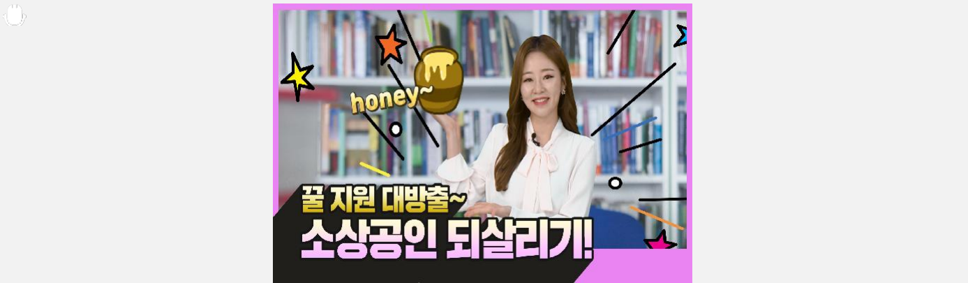
소상공인을 위한 긴급 추경예산 확보 코로나19의 칼바람에 힘든 소상공인들을 위해 전라북도...

b 코로나19 극복 - 전북도 소상공인 지원사업 소개 전북도 소상공인 지원 사업 소개 코로나19로 침체에 빠진 지역경제를 살리기 위해 전북도는 소상공인 신속 지원시스템을 구축 운영합니다. 지원 정책은 다음과 같습니다. 자금 완화 소상공인 특례보증 지원사업보증신청, 서류접수, 보증약정 업무를 시중은행에 위탁해 기존 한 달 가까이 걸리던 처리 속도를 2주 이내로 단축하고 일정 조건(영업기간 1년 미만, 신용등급 7등급 이하, 5천만원 초과 고액 신청자)을 만족하면 현장실사 없이 집행