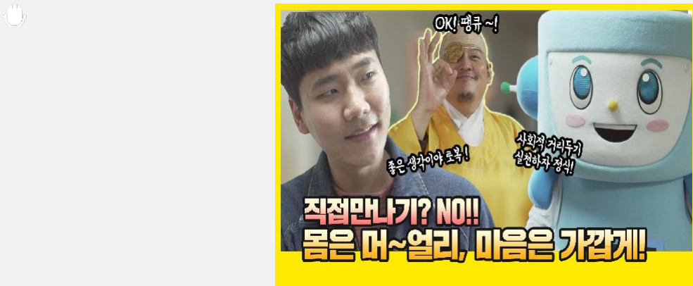
몸은 멀리~마음은 가까운 로복이와 정식이 정식야! 로복야청소하지 말고 우리 나가서 놀자PC방 ...