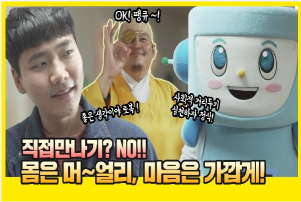
몸은 멀리~마음은 가까운 로복이와 정식이 정식이! 로복이청소하지 말고 우리 나가서 놀자PC방 ...