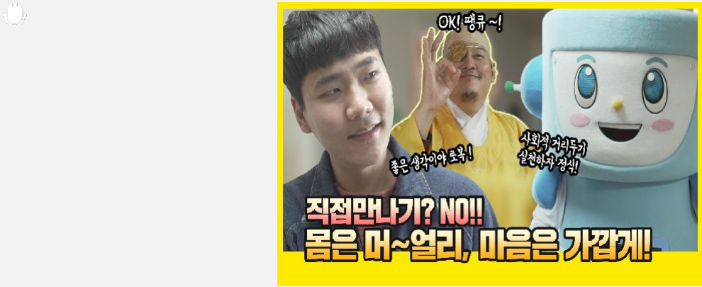
몸은 멀리~마음은 가까운 로복이와 정식이 정식이! 로복이청소하지 말고 우리 나가서 놀자PC방 ...