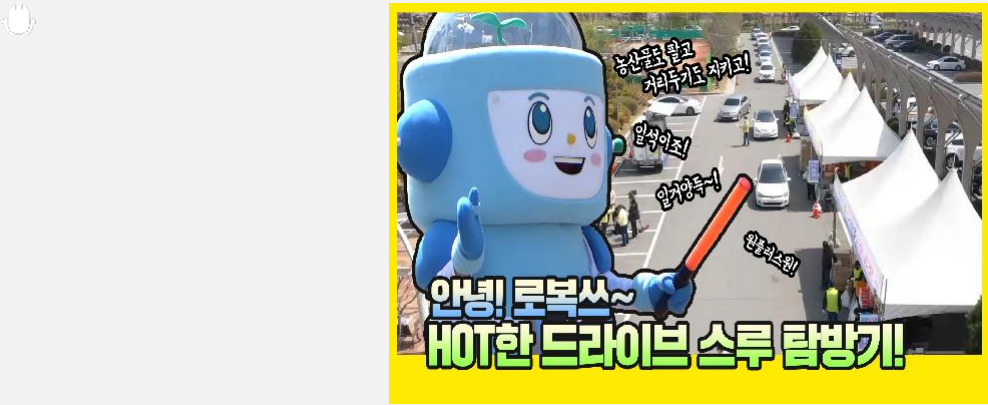
아이로복, 드라이브 스루에 가다! 로복아이 로복빼입파워 온한중 FLEX도대체 여기서 무...