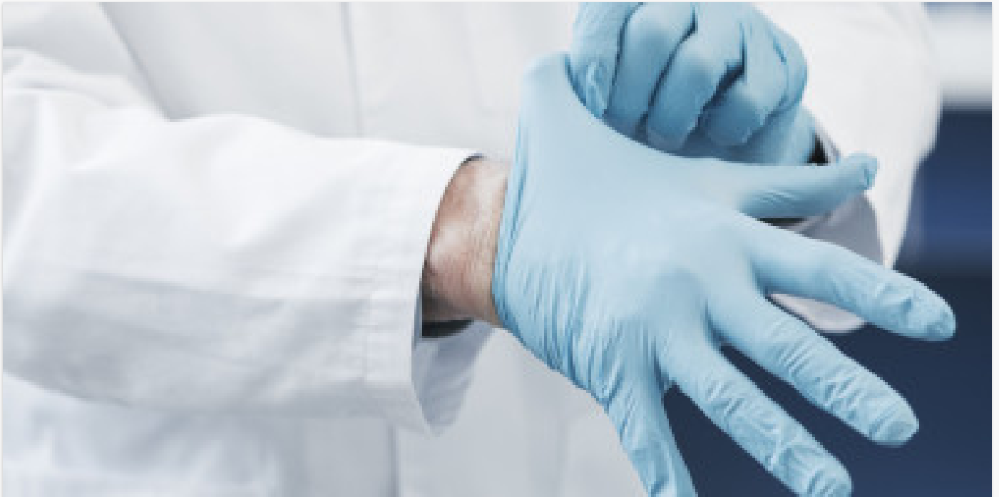
Asmens apsaugos priemonių paskirstymas Lietuvos medikams