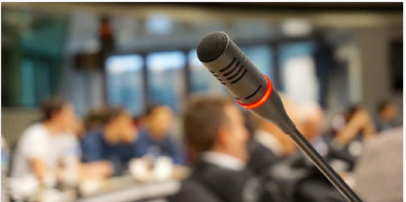
Dažniausiai užduodami klausimai