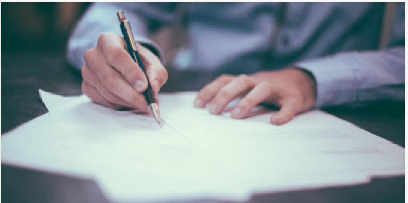
Operacijų vadovo sprendimai