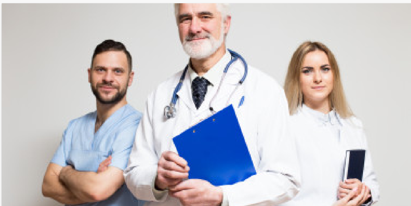
Informacija ASPĮ ir sveikatos priežiūros specialistams