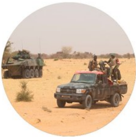
LA LUTTE CONTRE LE TERRORISME