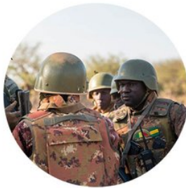
LE RENFORCEMENT DES CAPACITÉS DES FORCES ARMÉES DES ETATS DU G5 SAHEL