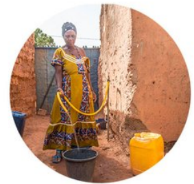
L'AIDE AU DÉVELOPPEMENT