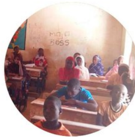
L'APPUI AU RETOUR DE L'ÉTAT ET DES ADMINISTRATIONS SUR LE TERRITOIRE