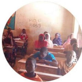
L'APPUI AU RETOUR DE L'ÉTAT ET DES ADMINISTRATIONS SUR LE TERRITOIRE