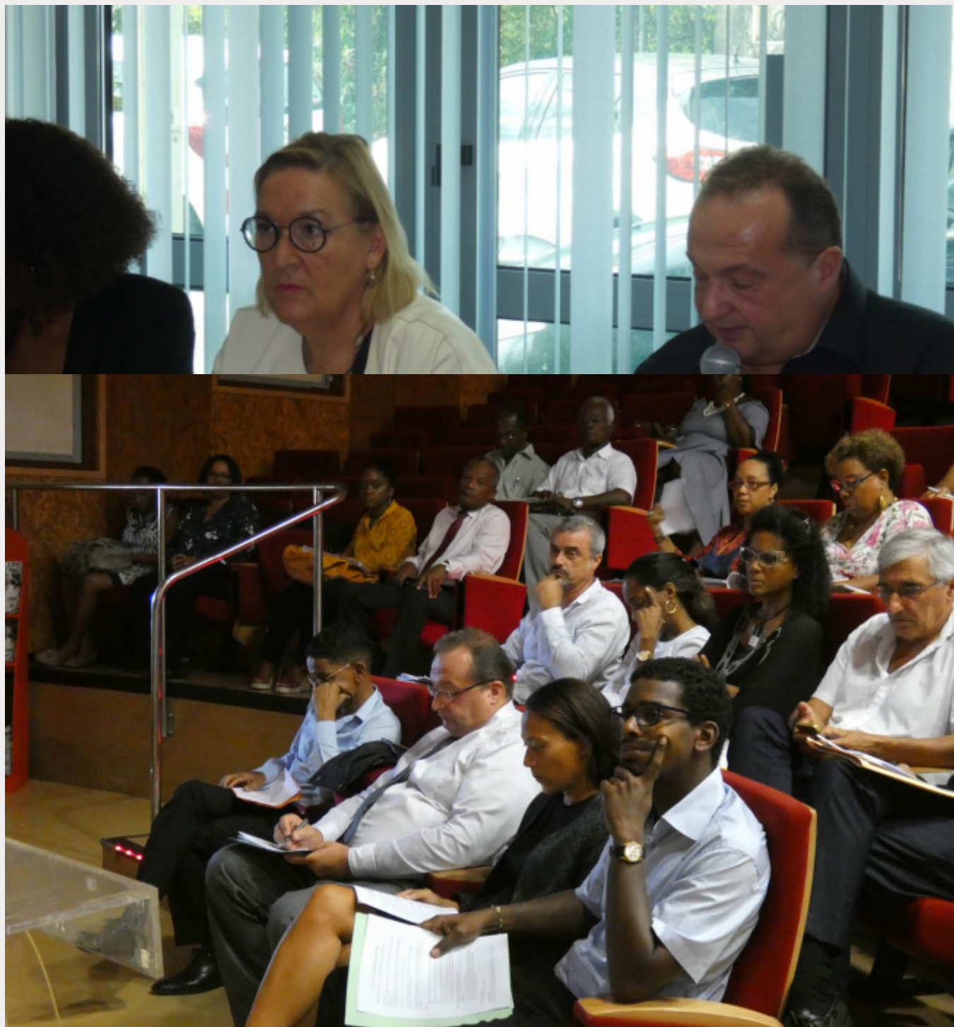
Stratégie cancer 2020-2030 : L'INCA en visite en Martinique