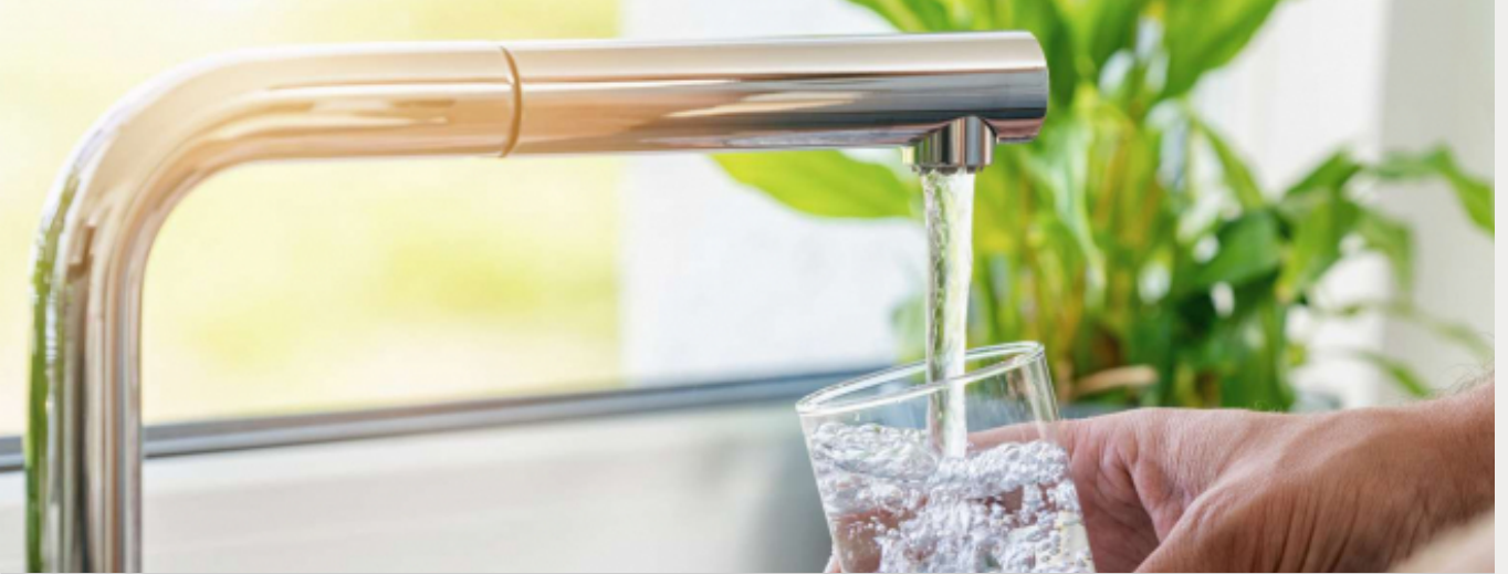
Carambole et insuffisance rénale