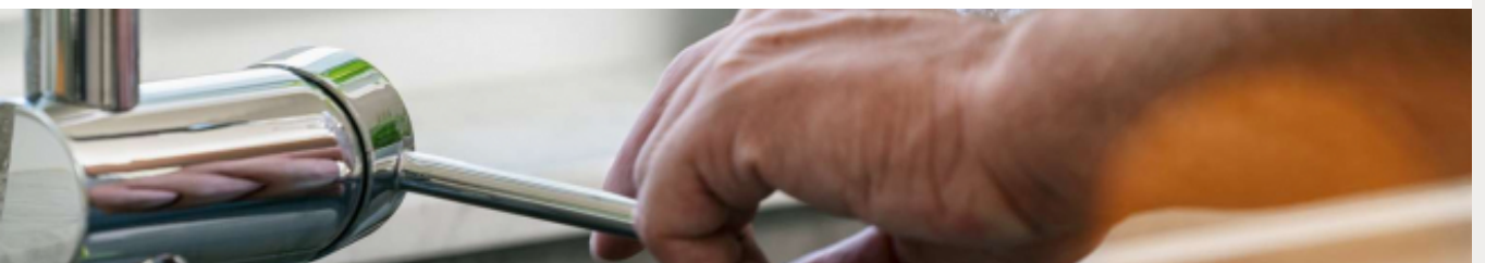
BROMATES : FIN DE LA RESTRICTION DE CONSOMMATION D'EAU