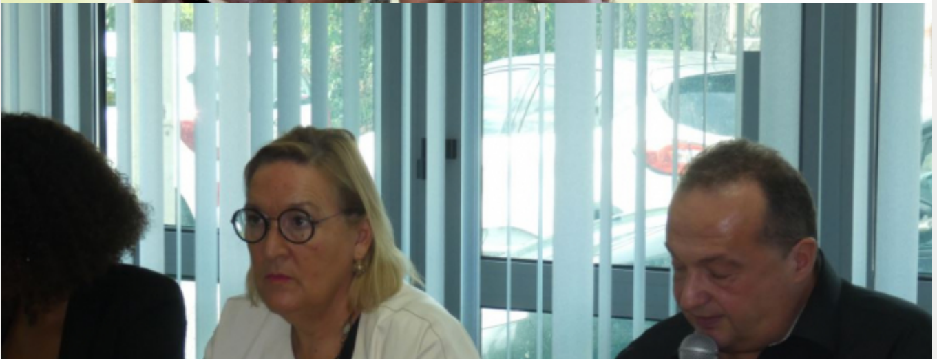
forum onco Antilles-Guyane 2019

Stratégie cancer 2020-2030 : L'INCA en visite en Martinique