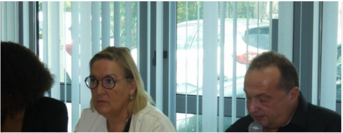
forum onco Antilles-Guyane 2019

Stratégie cancer 2020-2030 : L'INCA en visite en Martinique