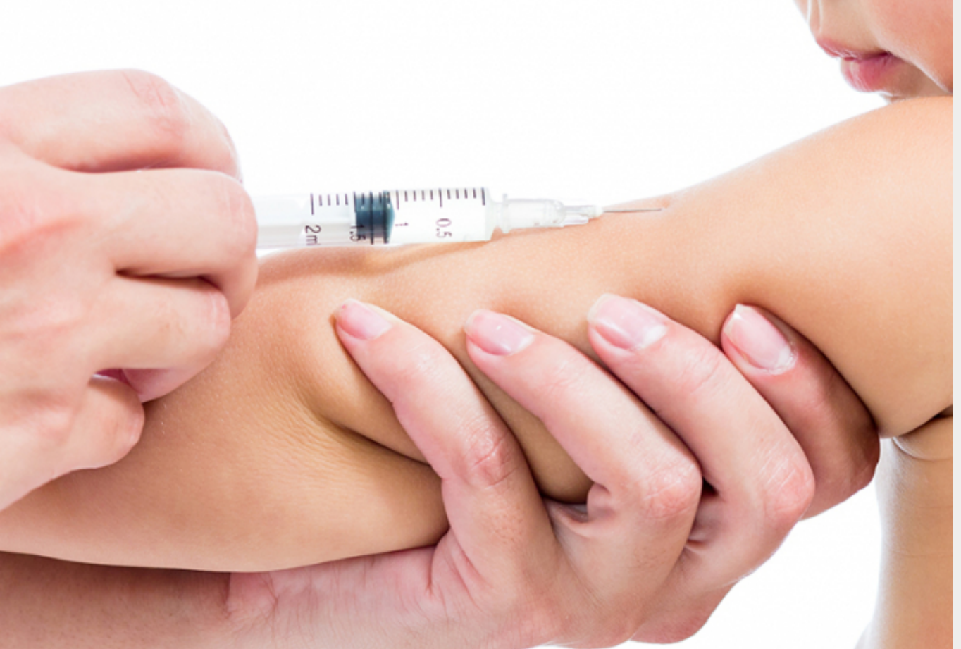
Rentrée 2019 : vacciner nos enfants pour une meilleure...