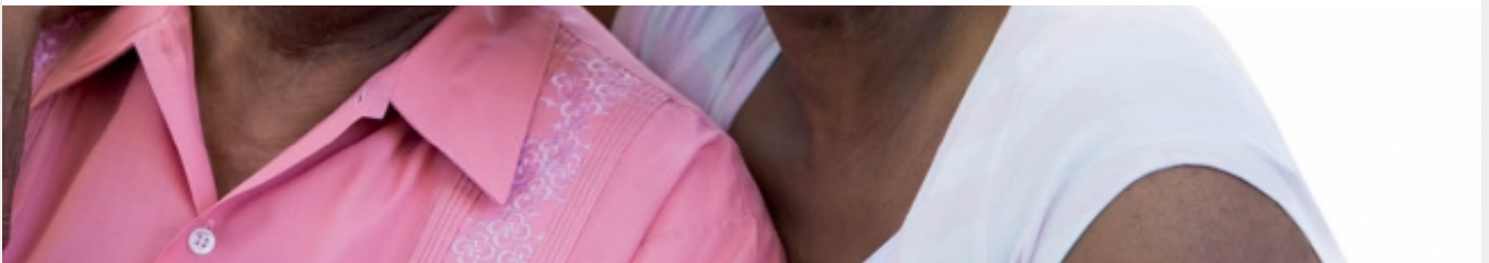
La semaine bleue : 7 JOURS POUR PARLER DE NOS AINES.