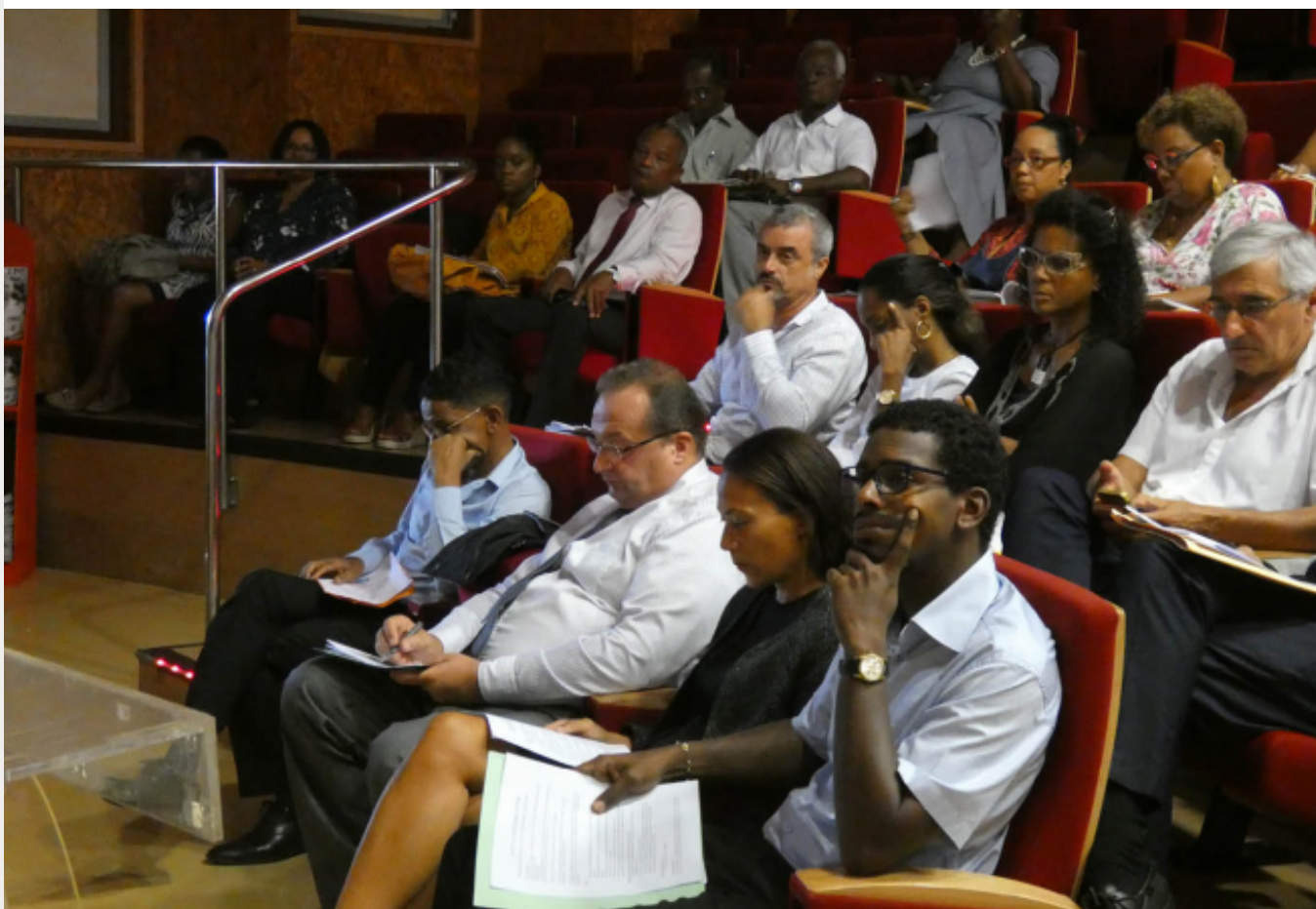
Stratégie cancer 2020-2030 : L'INCA en visite en Martinique