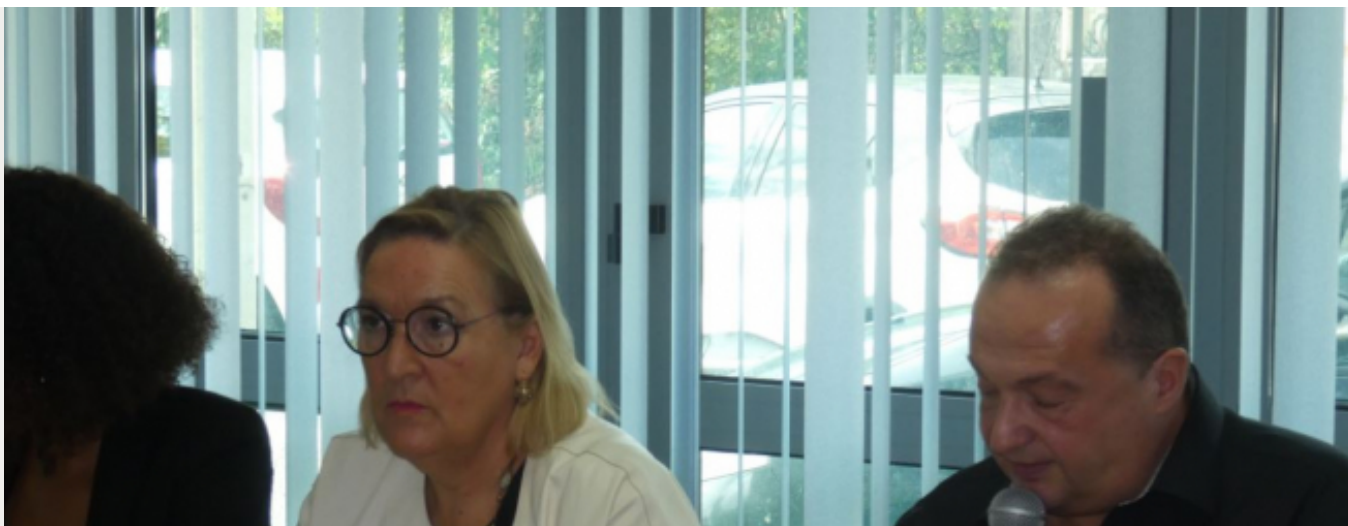
forum onco Antilles-Guyane 2019

Stratégie cancer 2020-2030 : L'INCA en visite en Martinique