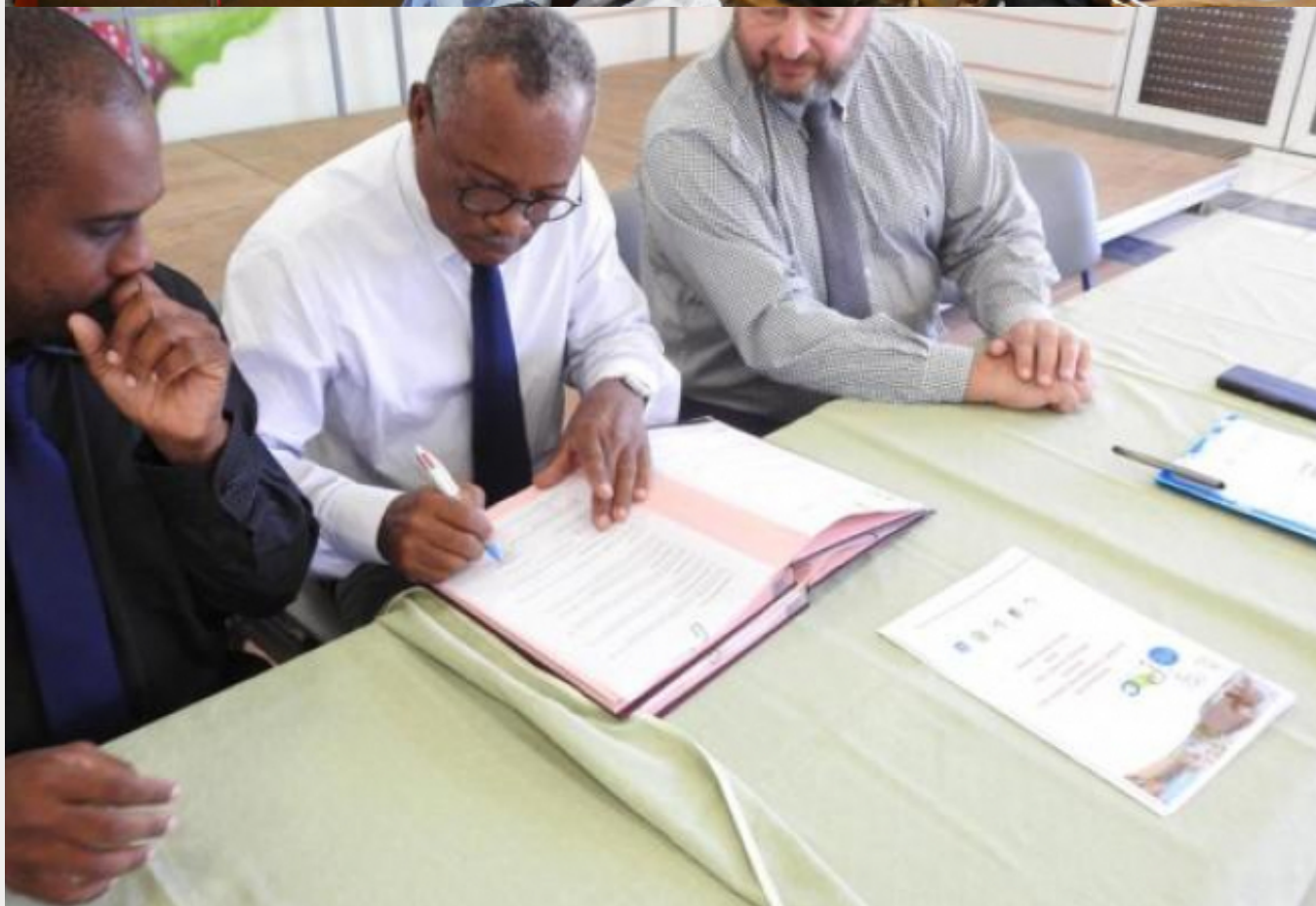
L'ARS Martinique inaugure les Points d'information cancer (PIC)