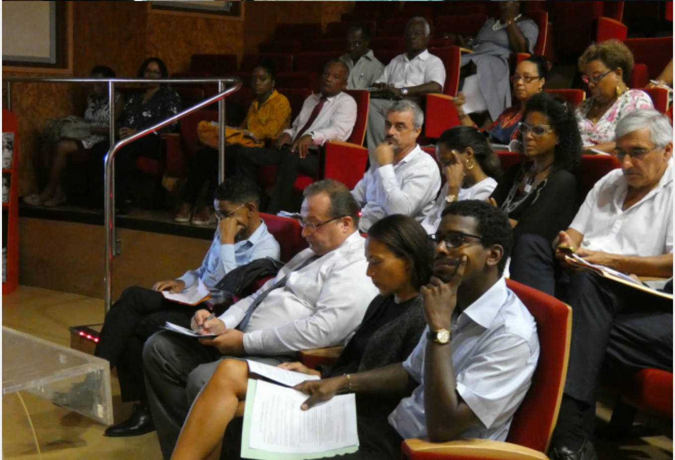
Stratégie cancer 2020-2030 : L'INCA en visite en Martinique