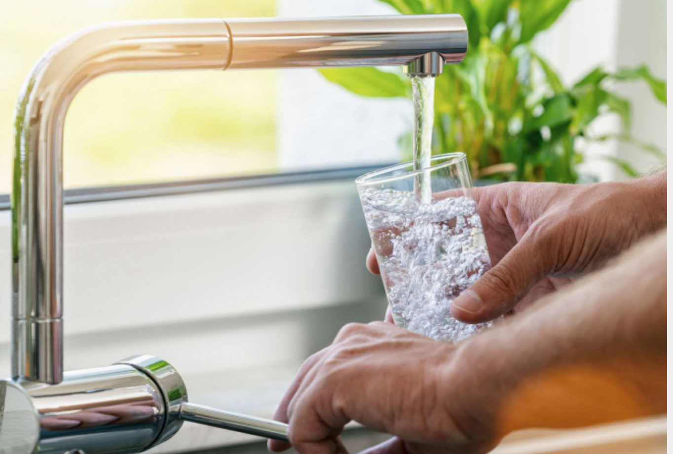
BROMATES : FIN DE LA RESTRICTION DE CONSOMMATION D'EAU