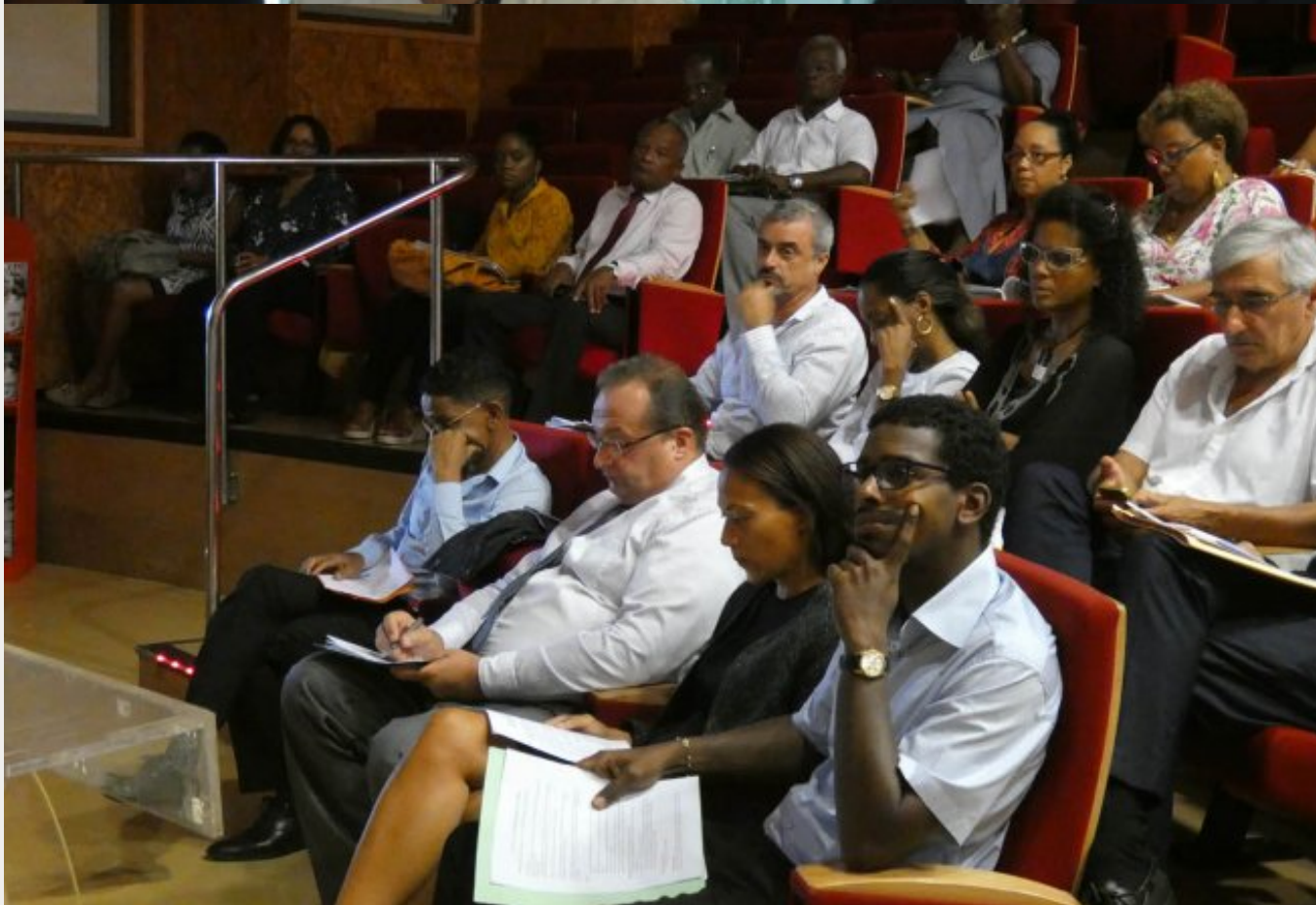
Stratégie cancer 2020-2030 : L'INCA en visite en Martinique