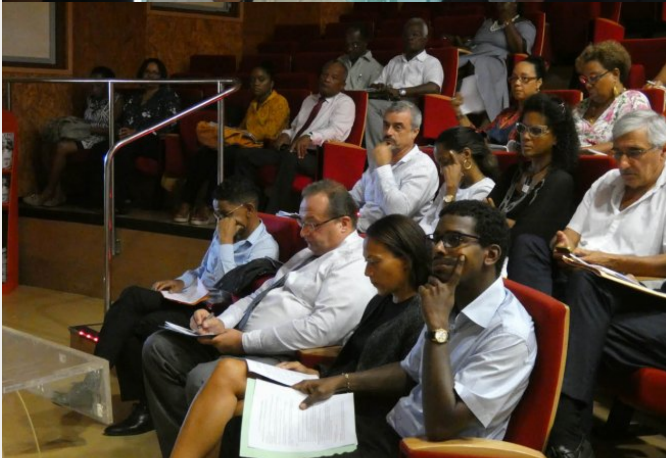
Stratégie cancer 2020-2030 : L'INCA en visite en Martinique