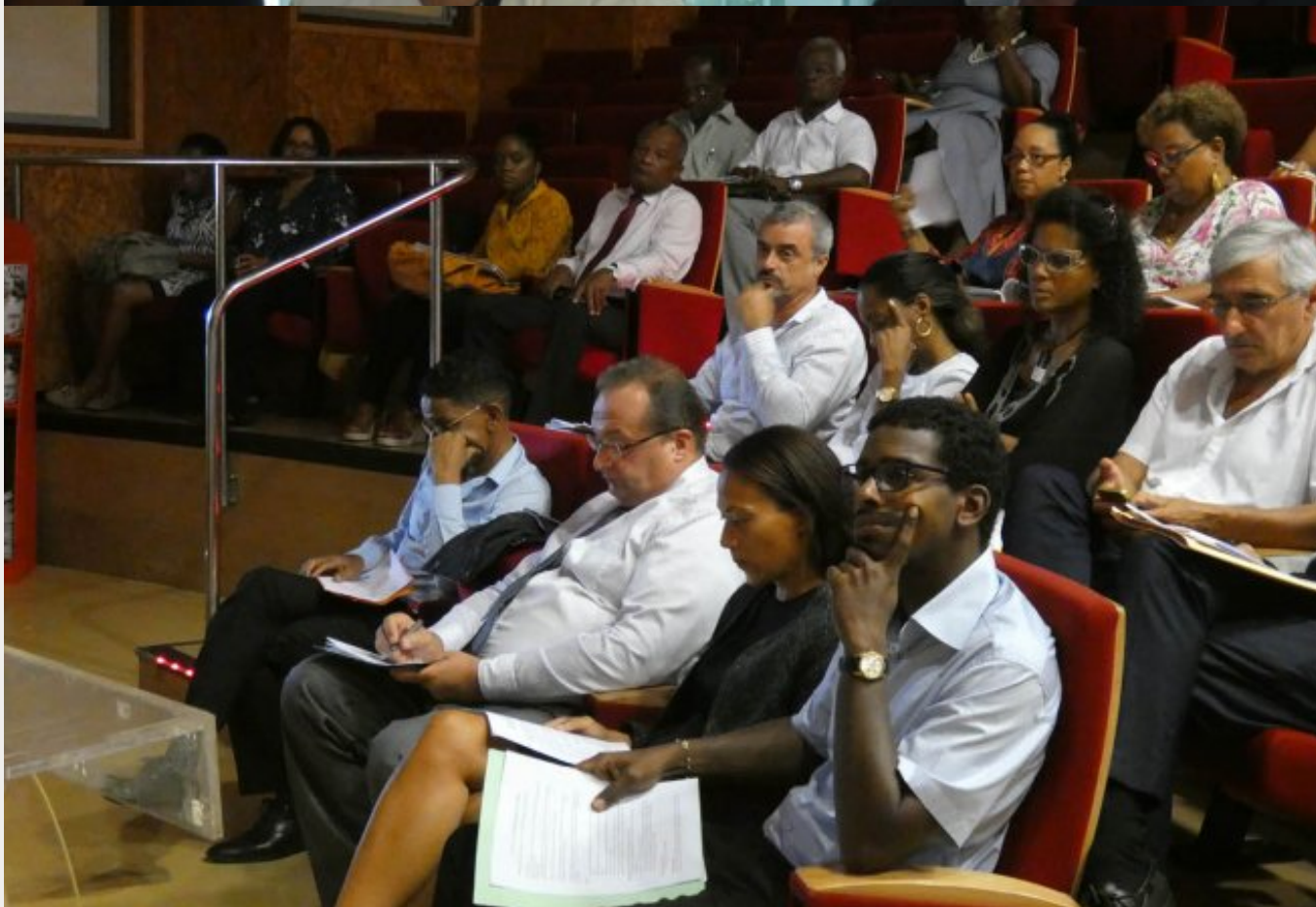
Stratégie cancer 2020-2030 : L'INCA en visite en Martinique