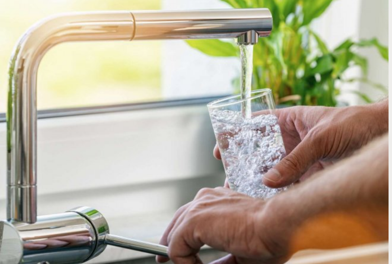
BROMATES : FIN DE LA RESTRICTION DE CONSOMMATION D'EAU