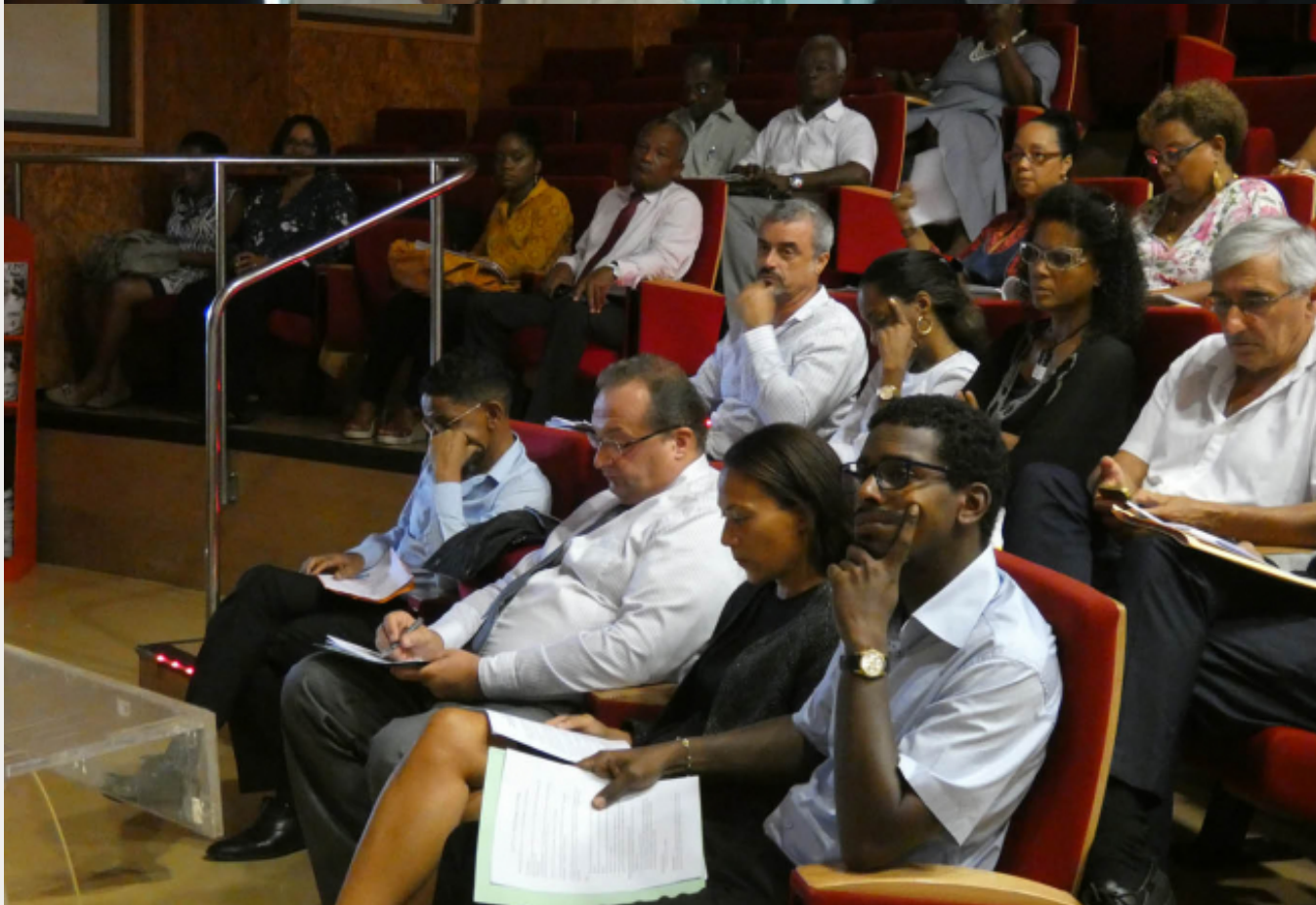
Stratégie cancer 2020-2030 : L'INCA en visite en Martinique