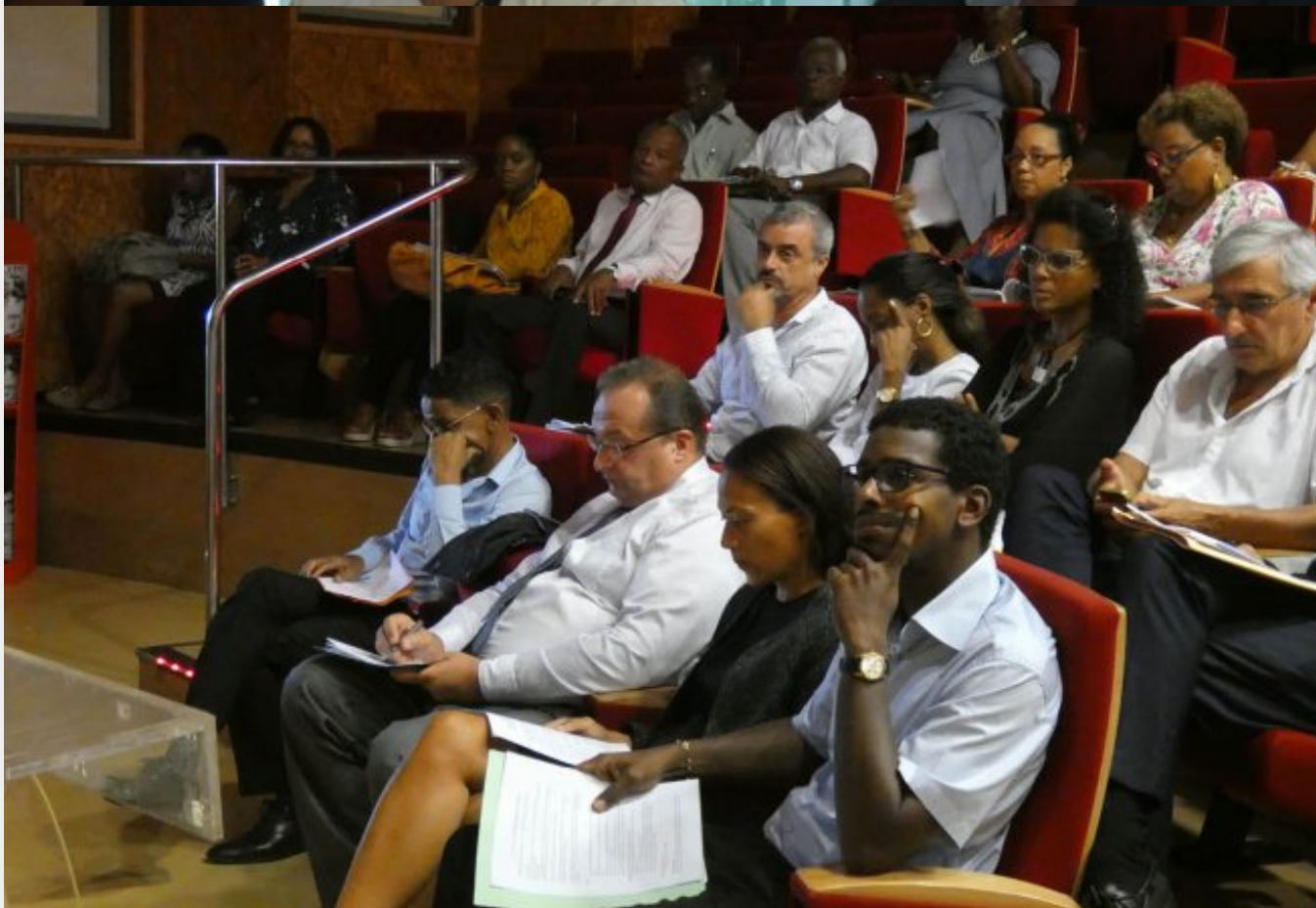
Stratégie cancer 2020-2030 : L'INCA en visite en Martinique