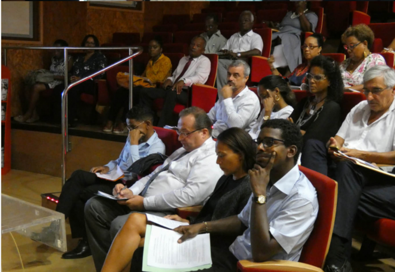
Stratégie cancer 2020-2030 : L'INCA en visite en Martinique