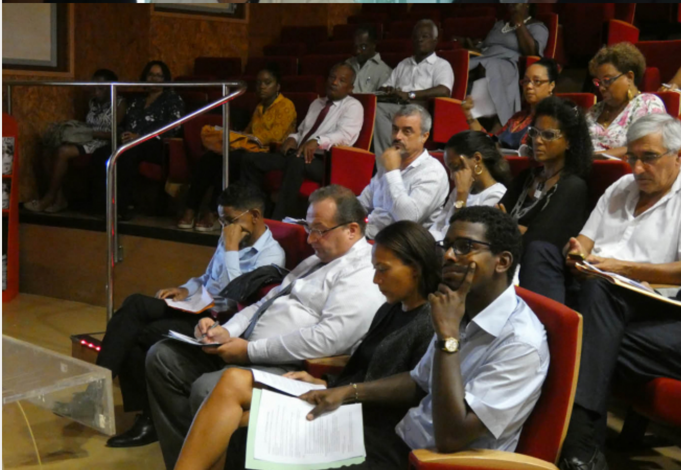
Stratégie cancer 2020-2030 : L'INCA en visite en Martinique