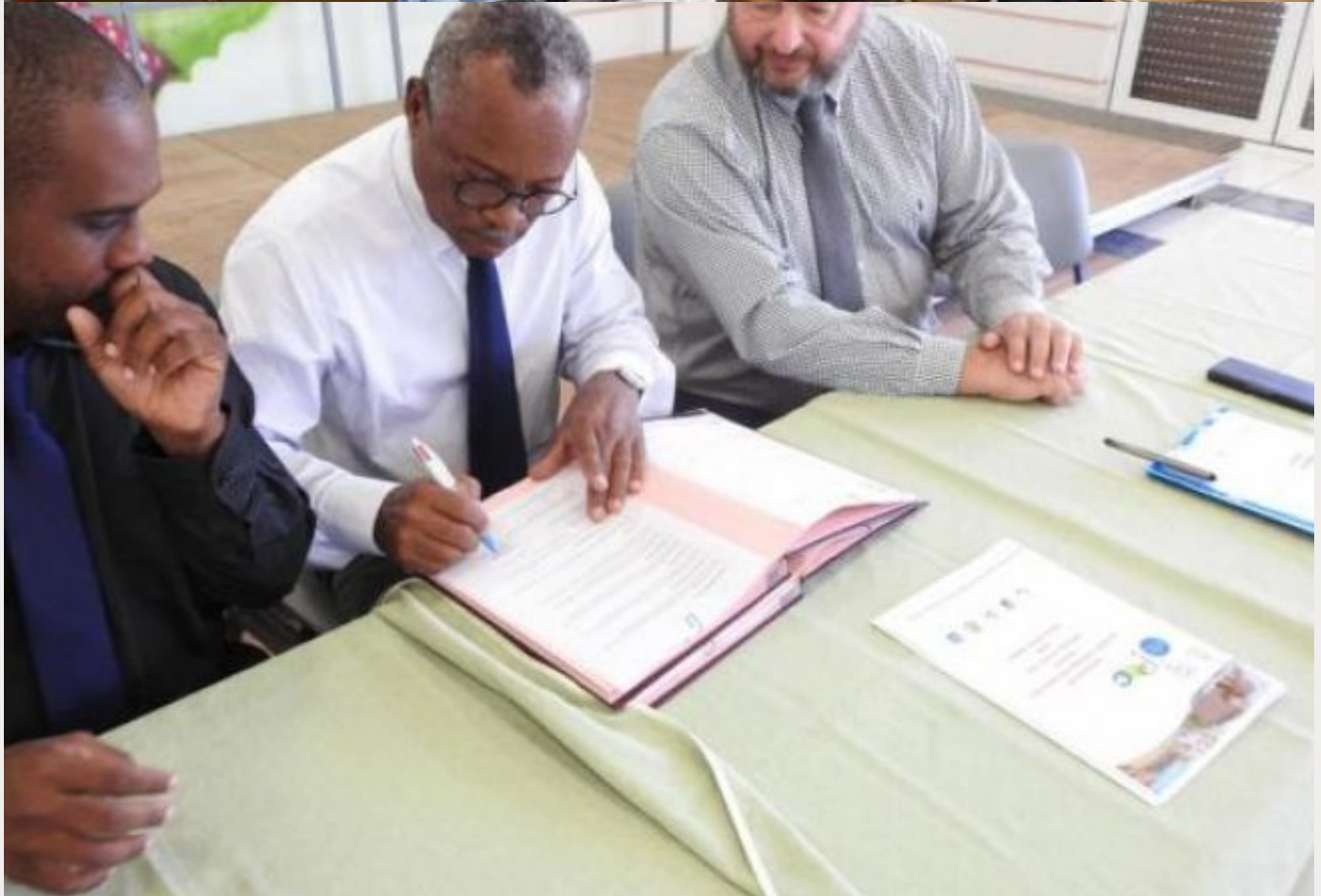
L'ARS Martinique inaugure les Points d'information cancer (PIC)