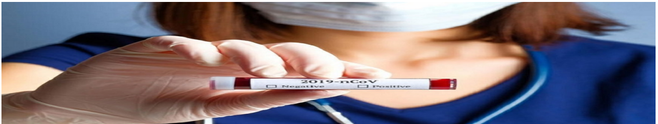
Evite ir a países con circulación de COVID-19 para impedir dispersi