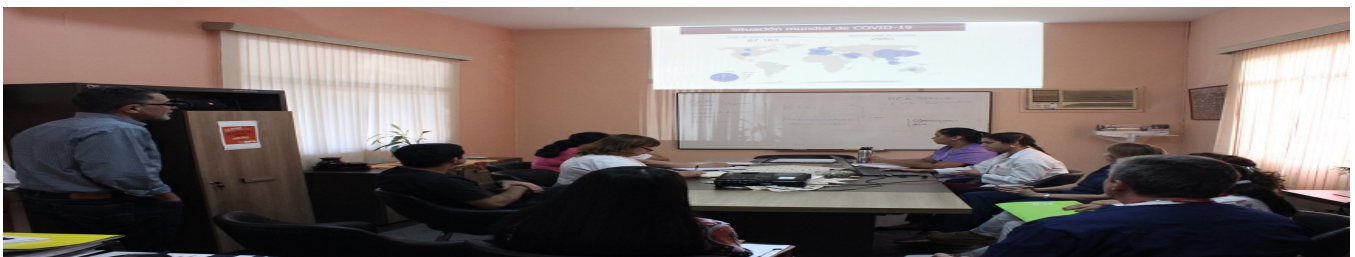
El "Acosta Ñu" crea sala de situación por COVID 19