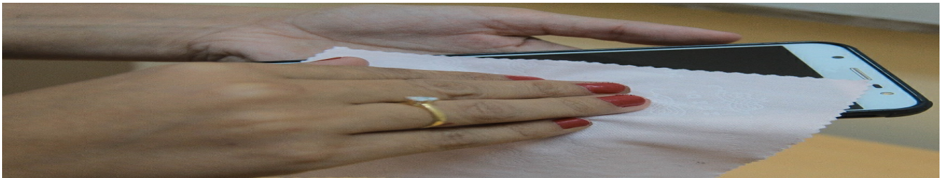
COVID-19: lavado de manos y desinfección de superficies como medidas