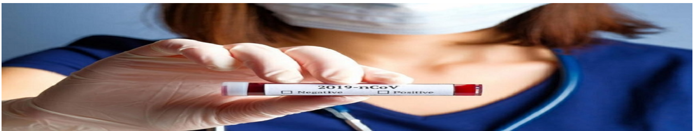
Evite ir a países con circulación de COVID-19 para impedir dispersi