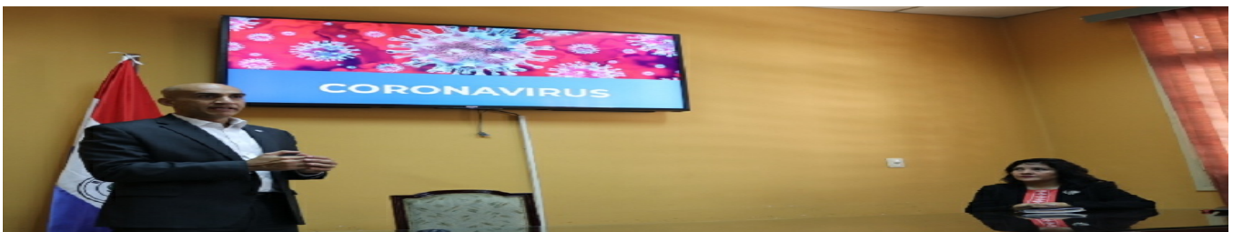
COVID: emisión de medidas preventivas en aerolíneas y transporte ter