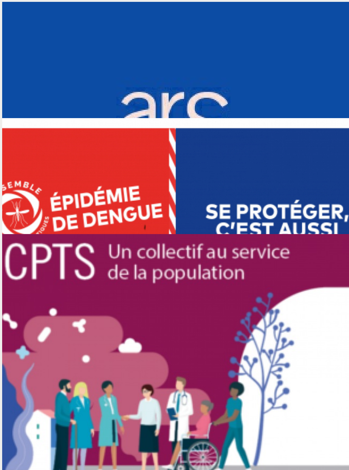
Accompagnement des CPTS : l'ARS soutient l'élaboration des...