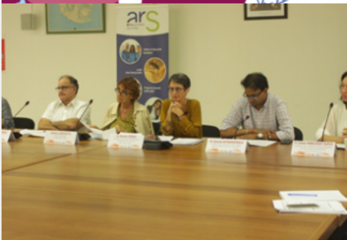
Lutte contre le diabète : une feuille de route 2020-2023 à La...

CPTS Un collectif au service de la population