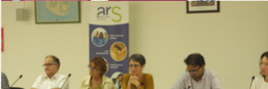
Création de l'Agence Régionale de Santé de La Réunion

1er janvier 2020 : création de l'ARS La Réunion