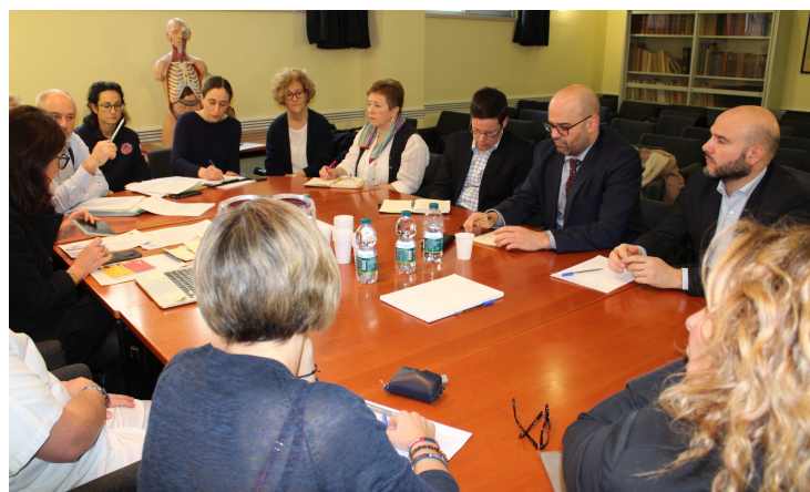
CORONAVIRUS Comunicati stampa del Gruppo Emergenze Sanitarie