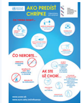
Leták - Chrípka