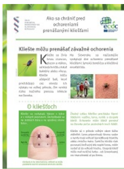
SAR PEŠ TE ARAKHEL LE KLEIŠŤOSTAR