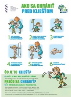
Ako sa chrániť pred kliešťom - verejnosť