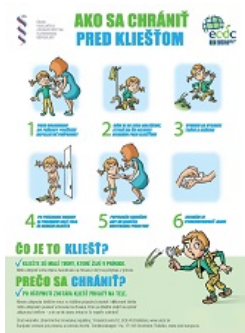
Ako sa chrániť pred kliešťom - verejnosť