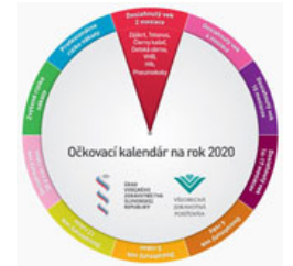
Význam očkovania – Choroby, ktorým môžeme vďaka očkovaniu predchádzať