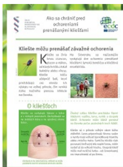
SAR PES TE ARAKHEL LE KLIESTOSTAR