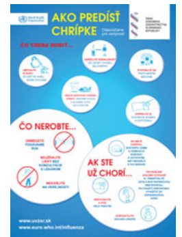
Leták - Chrípka