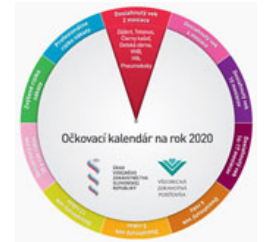
Význam očkovania – Choroby, ktorým môžeme vďaka očkovaniu predchádzať