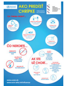
Leták - Chrípka