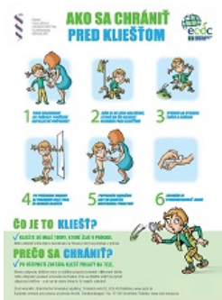
Ako sa chrániť pred kliešťom - verejnosť