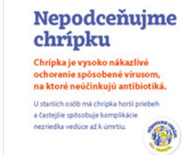
Leták - Chrípka seniori