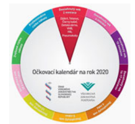
Význam očkovania – Choroby, ktorým môžeme vďaka očkovaniu predchádzať