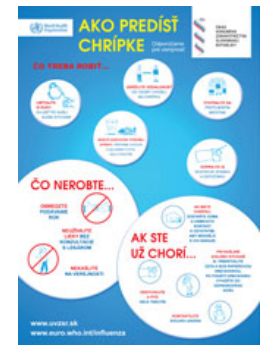
Leták - Chrípka