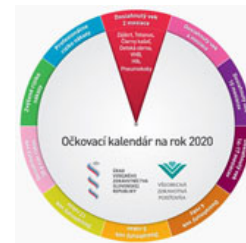
Význam očkovania – Choroby, ktorým môžeme vďaka očkovaniu predchádzať