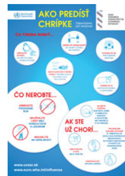
Leták - Chrípka