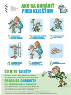
Ako sa chrániť pred kliešťom - verejnosť