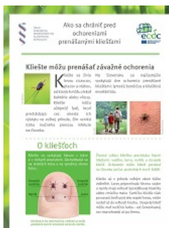
SAR PES TE ARAKHEL LE KLIESTOSTAR