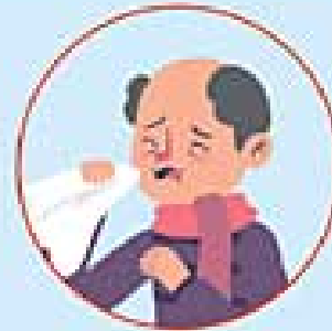
falta de aire

PERMANEZCA EN CASA Y LLAME A SU CENTRO DE SALUD.