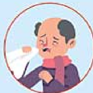
falta de aire

PERMANEZCA EN CASA Y LLAME A SU CENTRO DE SALUD.