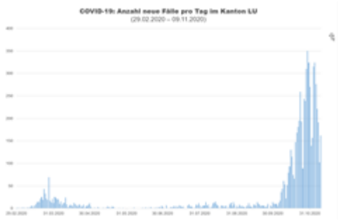
COVID-19: Anzahl neue Fälle pro Tag im Kanton Luzern

00000000 0000000000 000000 000000 4E657565 46E46C6C65 70726F 546167