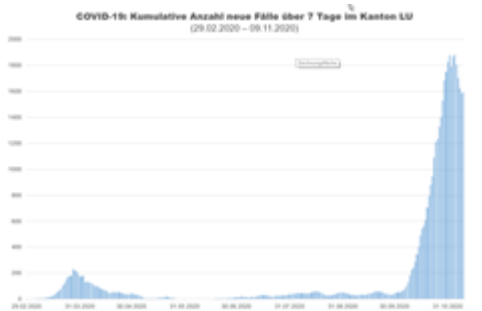
COVID-19: Kumulative Anzahl neue Fälle über 7 Tage im Kanton Luzern

Anzahl neue Fälle pro Tag im Kanton Luzern