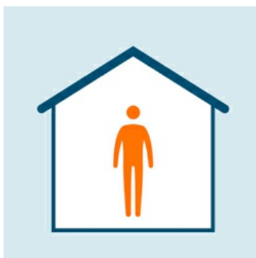
In caso di sintomi rimanere a casa