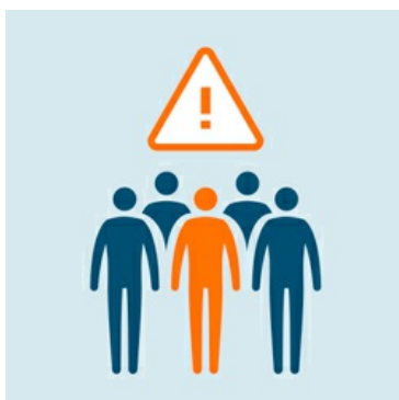
Evitare luoghi affollati