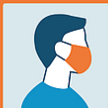
Usare la mascherina