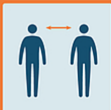
Tenersi a distanza