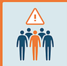
Evitare luoghi affollati

Prudenza, sempre. Hotline cantonale 0800 144 144 e www.ti.ch/coronavirus