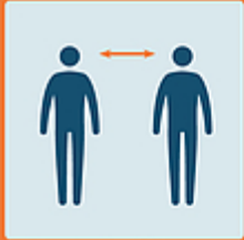
Tenersi a distanza