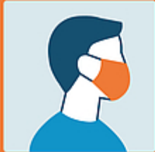
Usare la mascherina