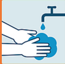
Lavarsi le mani