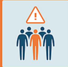
Evitare luoghi affollati

Prudenza, sempre. Hotline cantonale 0800 144 144 e www.ti.ch/coronavirus